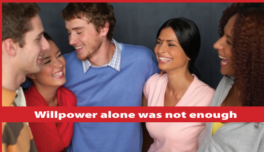
Willpower alone was not enough