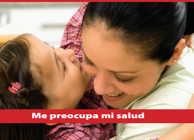
Me preocupa mi salud