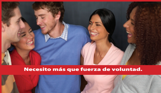
Necesito más que fuerza de voluntad.