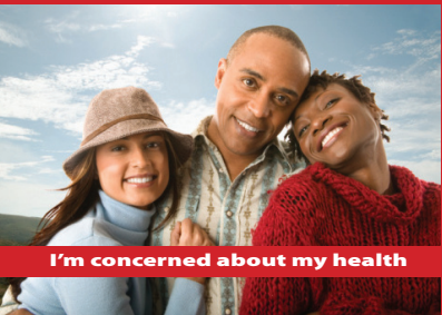
I'm concerned about my health